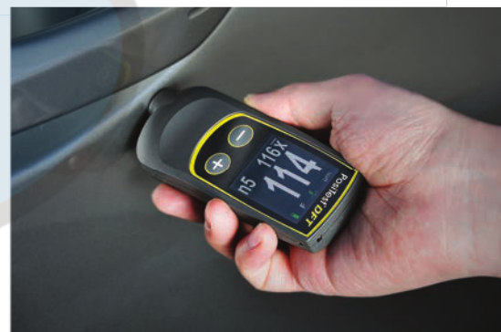
Pantalla auto giratoria con bloqueo de rotación

TODOS LOS MEDIDORES VIENEN COMPLETOS con correa para la muñeca, calzas de plástico de precisión, estuche rígido, 2 baterías alcalinas AAA, instrucciones, Certificado de Calibración de Forma Larga trazable a PTB, garantía de dos años.