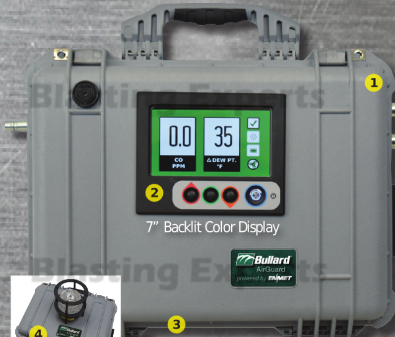
7" Backlit Color Display